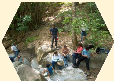
Estudiantes en el yacimiento Cagüitas

Ahora las personas interesadas pueden estudiar su Maestría en Arqueología en Puerto Rico a diferencia del pasado en que tenían que estudiar fuera del país. Las y los egresados de este programa estarán cualificados para desempeñarse en las fases de investigaciones arqueológicas requeridas por el Consejo de Arqueología Terrestre de Puerto Rico y para emplearse como consultor o consultora privada. También podrán trabajar en puestos en el gobierno (estatal o federal), en investigación en las universidades del país y continuar estudios a nivel doctoral.